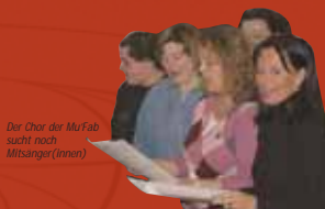
Der Chor der MUFAB sucht noch Mitsänger(innen)

Themen - vermitteln den Kundinnen und Kunden die besonderen Vorzüge der innovativen Haarpflege- und Stylingserien, die „hairshop“ führt.