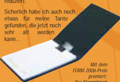
Mit dem FORM 2006-Preis premiierter: Der Klemmblock