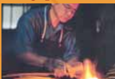
Handgefertigte japanische Messer jetzt beim Scheins

Die Winterabende werden lang und kalt. Freuen kann sich, wer einen Kaminofen hat, vor dem er gemütlich sitzen und ein Buch lesen kann. Aber bevor es soweit ist, hat der Herr die Arbeit gesetzt. Die richtigen Werkzeuge zum Zerklleinern findet man bei Scheins Eisenwaren am Grünen Weg. Der Eisen Scheins? Jawohl! Dort gibt es nicht nur Schrauben und Rasenmäher, Werkzeuge und Baubeschläge, sondern auch (Ketten-)Sägen, Axte und Holzspalter. Wer also ein bisschen Unterstützung zur Zerklleinern des Brennholzes benötigt, findet hier das richtige