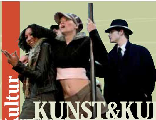
Die Station der Linie 1 ist in die Liebigstraße verlegt worden.