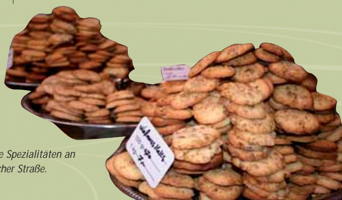
Persische Spezialitäten an der Jülicher Straße.