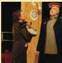
Liebe spielen