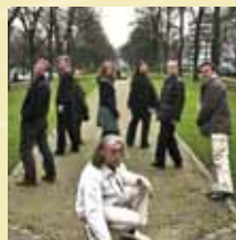
Stadtgesichter Foto Theater K