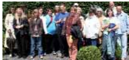
Auf dem Reitturniergelände

Beim Sommerfest von Behrens gab es eine Blumenstauden zum mitnehmen, im Hair Shop Herff zur Frisur noch ein Haarpflegemittel, und bei Adler ein besonderes Geschenk.