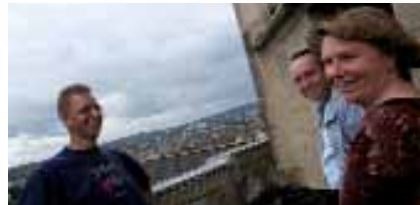
Blick von St. Elisabeth

verschiedene türkische Vorspeisen gab. Danach war wieder Kultur angesagt: Im NAK und in der Galerie Freitag 1830 gab es einen Einblick in die aktuellen Ausstellungen. Dazwischen ging es viele Stufen hinauf auf den Turm von St. Elisabeth um sich ein bisschen Wind um die Nase wehen zu lassen und das Viertel von oben zu genießen.