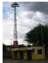
Graue Wolken über dem Tivoli

Noch mehr Ärger droht dem neuen Stadion aber von einer Bürgerinitiative, die für eine parkplatzfreie Soers protestiert. Denn zwischen JVA und Autobahnauffahrt liegt das Wurmgelände Hochbrücker Mühle, ein Überschwemmungsgebiet soll 1200 Parkplätzen für die Alemannia weichen. Mehr Informationen unter: www.hochbruecker-muehle.de