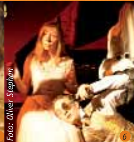
6 Der Sandmann