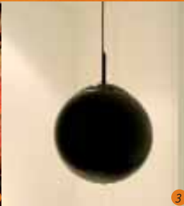
3 Albrecht Schäfer Schwarzes Licht