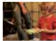
Ziehung des Gewinners für die Carolus Themen