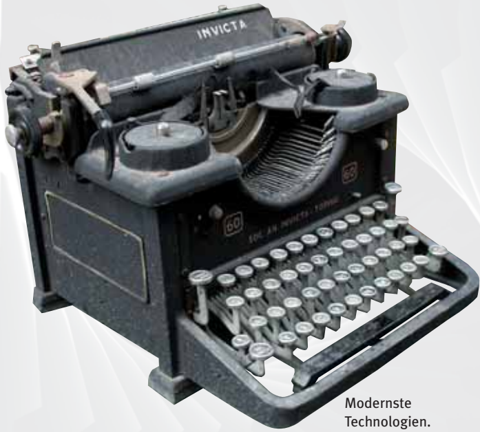
Modernste Technologien. (Teil 1)