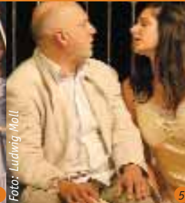
5 Die Liebe des Don Perlinplin