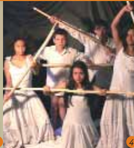
4 Corazón de cebolla