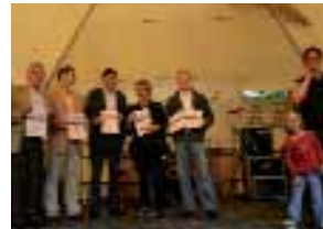
Ehrung der Sponsoren der Flaggen für den Europaplatz