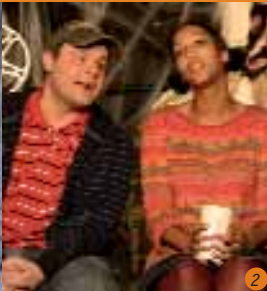
2 DasDa Wer ist der Größte?