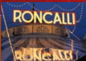
Circus Roncalli auf dem Blücherplatz

DAS AACHEN NORD QUIZ 3x 2 Tickets FÜR RONCALLI & DASDA THEATER ZU GEWINNEN!