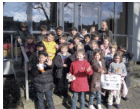
Klasse 2 a

„Mir hat dieses Projekt großen Spaß gemacht. Am besten gefallen hat mir, als wir unsere Köpfe fotografiert haben. Wir haben viel über unsere Gefühle und die Gefühle der anderen gelernt. So haben wir gelernt, wie wir besser miteinander umgehen können, nämlich ohne Gewalt.“