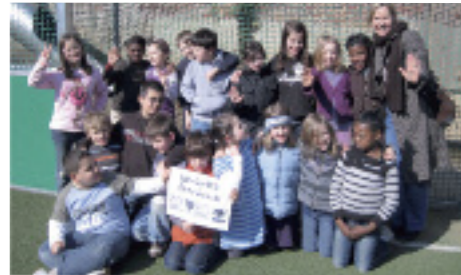
Klasse 2 b