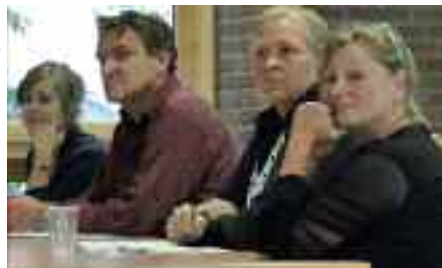
Die Vorbereitungsgruppe nahm interessiert die Anregungen der Anwesenden auf.

Am 8. Juni hatte der Arbeitskreis Rehmviertel zum zweiten Mal zur Vorbereitung der Stadtteilkonferenz Aachen Nord eingeladen und wieder kamen viele Akteure und Akteurinnen aber auch interessierte Bewohner und Bewohnerinnen des Viertels zusammen, um sich über Ideen zur Entwicklung Aachen Nord auszutauschen. Der Verkehr an der Jülicherstraße war dabei ebenso Thema wie der Zustand von Spielplätzen und Begegnungsmöglichkeiten für ältere MitbewohnerInnen. Kein Thema wurde ausgeschlossen, zu